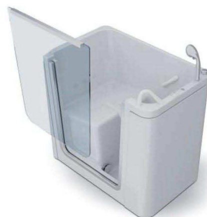
MODELLO DA 100 MODELLO DA 110 MODELLO DA 130